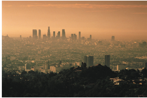
El ozono es el ingrediente principal del smog.

El ozono, el ingrediente principal del smog, presenta un problema serio para la calidad del aire en muchas partes de los Estados Unidos. Aún a niveles bajos, el ozono puede causar un número de problemas respiratorios. Usted puede tomar unos pasos sencillos, descritos en este folleto, para protegerse del ozono.