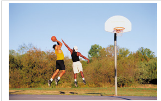
Los niños y adultos de todas las edades que realizan actividades al aire libre tienen mayor riesgo de salud al exponerse al ozono.

En general, a medida que las concentraciones de ozono al nivel del suelo aumentan, más personas sienten los efectos de salud, más serios se vuelven los efectos, y más personas son admitidas a los hospitales por problemas respiratorios. Cuando los niveles de ozono son muy altos, todos nos debemos preocupar por la exposición al ozono.